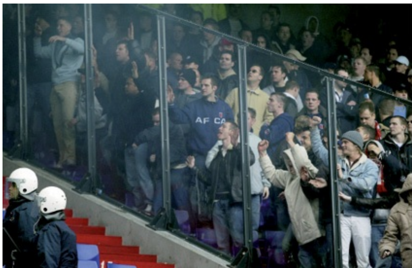
Ajax-supporters dagen vanuit het uitvak in De Kuip de Feyenoord-supporters uit tijdens de wedstrijd van 11 april 2004.