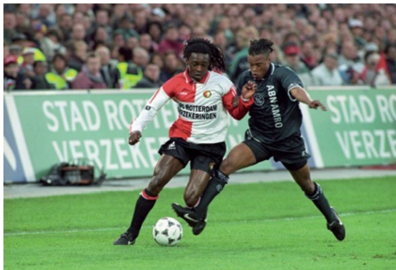
Edgar Davids zet Regi Blinker de voet dwars tijdens de wedstrijd in De Kuip op 18 mei 1995.