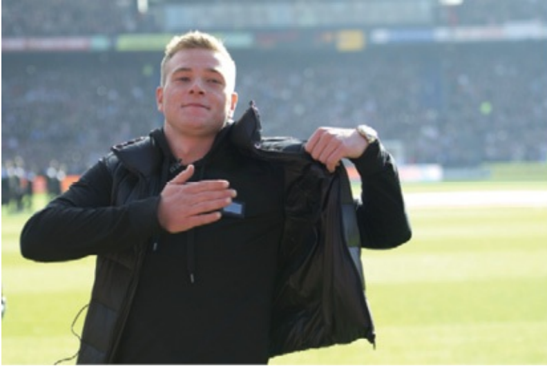
John Guidetti neemt afscheid van het Feyenoord-publiek in de rust van de wedstrijd op 28 oktober 2012.