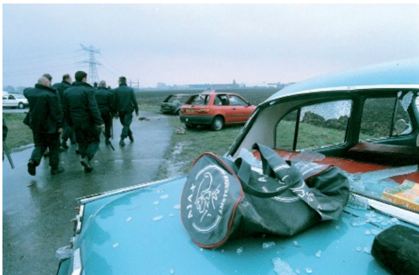
De me loopt langs vernielde auto's na de Slag van Beverwijk op 23 maart 1997.