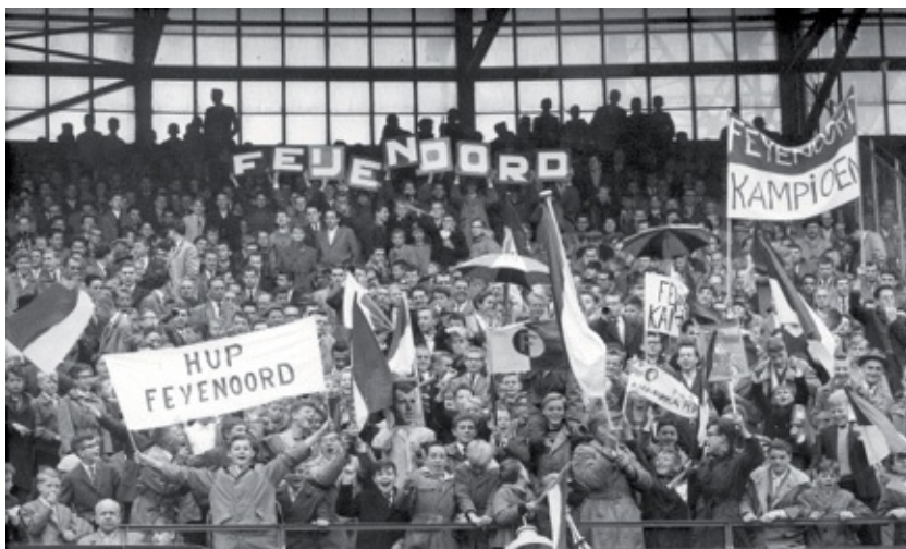
Feestend publiek in De Kuip na de competitiewedstrijd op 22 mei 1960, die een beslissingswedstrijd noodzakelijk maakte.