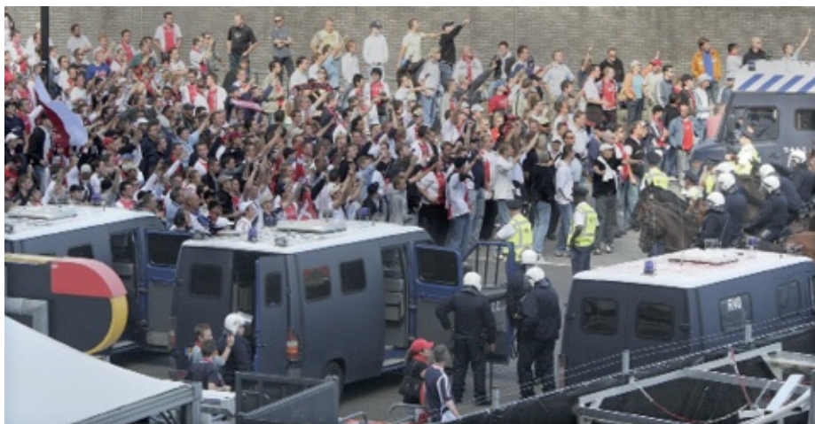
Ajax-supporters tegenover de me bij de aankomst van de Feyenoord-supporters bij de Arena voor de wedstrijd van 28 augustus 2005.