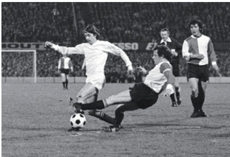
Rinus Israël zet een tackle in op Johan Cruijff tijdens de wedstrijd in De Kuip op 15 april 1972. Rechts scheidsrechter Ad Boogaerts en Theo Laseroms.