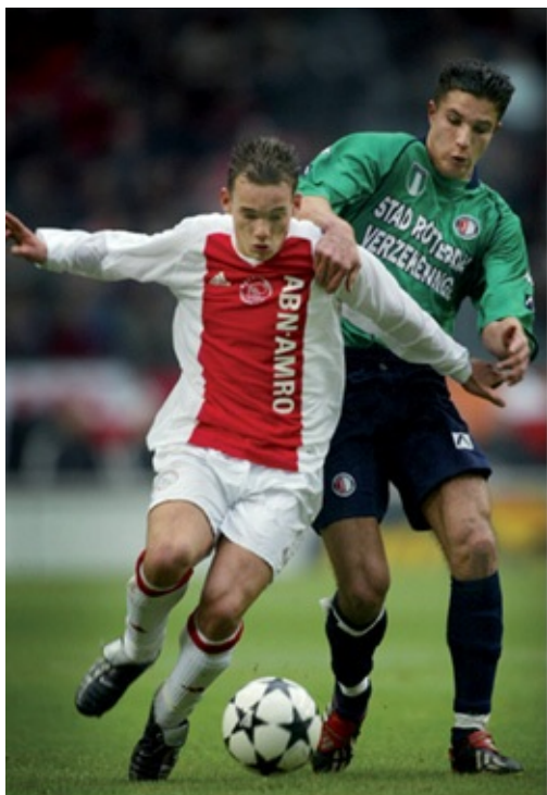
Wesley Sneijder in duel met Robin van Persie tijdens de wedstrijd van 9 februari 2003 in de Arena.