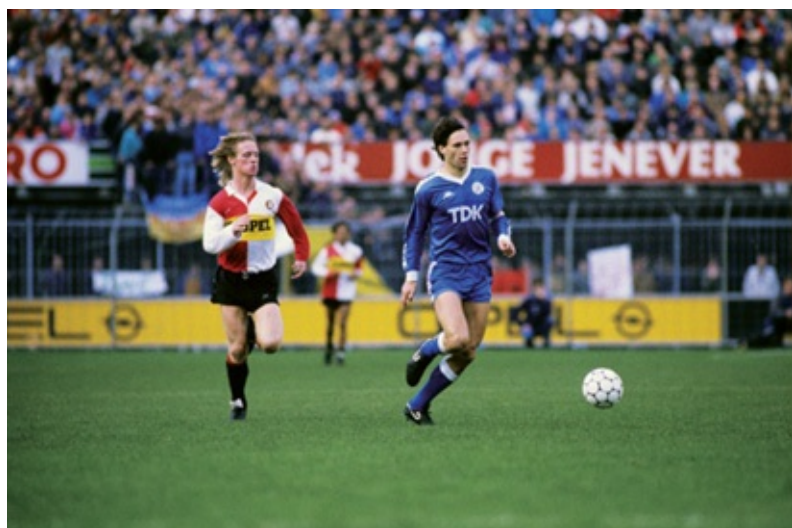
Mario Been achtervolgt Marco van Basten tijdens de wedstrijd van 2 november 1986 in De Kuip.