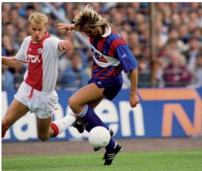
John de Wolf schermt de bal af voor Dennis Bergkamp tijdens de wedstrijd van 20 mei 1991 in het Olympisch Stadion.