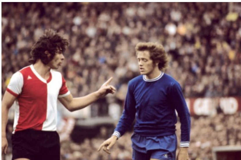
Wim van Hanegem waarschuwt Arie Haan tijdens de wedstrijd van 27 oktober 1974 in De Kuip.