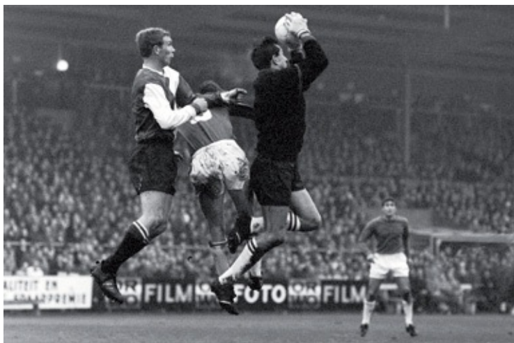
Eddy Pieters Graafland vangt de bal tijdens de wedstrijd van 13 november 1966 in De Meer, met achter zich Hans Kraay en Johan Cruyff. Sjaak Swart kijkt toe.