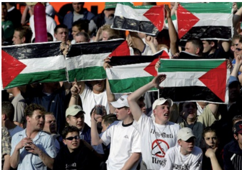
Feyenoord-supporters dagen Ajax-supporters uit met Palestijnse vlaggen en 100% antineusshirts tijdens de bekerwedstrijd van 16 april 2003 in De Kuip.